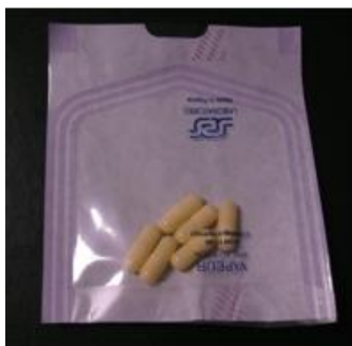
Les 6 gélules à ingérer